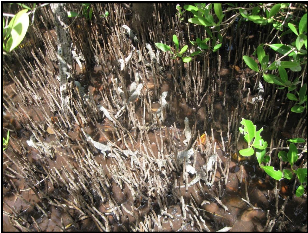
Se liberaron en su habitat natural

FUNDACIÓN Islas de la Bahía Estación de investigación y cria de Iguanas, Ba. Jericó sobre calzada Iguana Road Utila Islas de la Bahía. Honduras, C.A. Phone/Fax (504) 425 3946 e-mail: fundacion.islas@gmail.com http://www.utila-iguana.de/fib/index.html